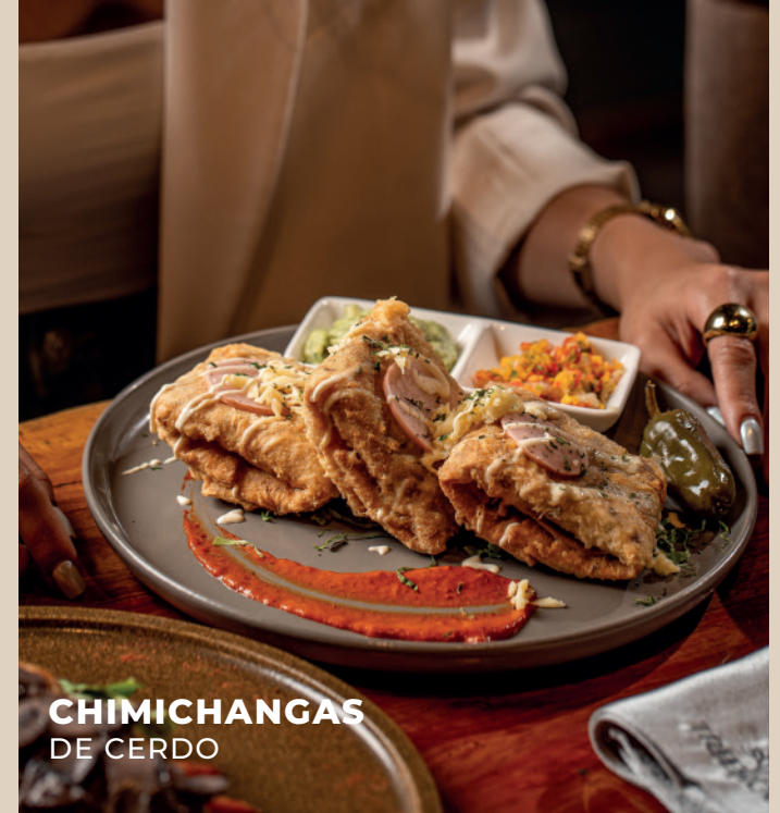
CHIMICHANGAS DE CERDO