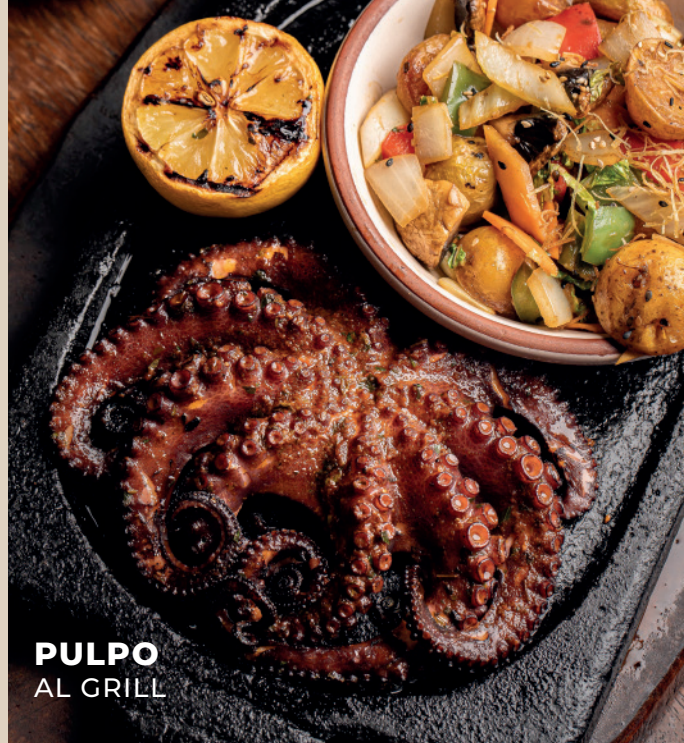
PULPO AL GRILL