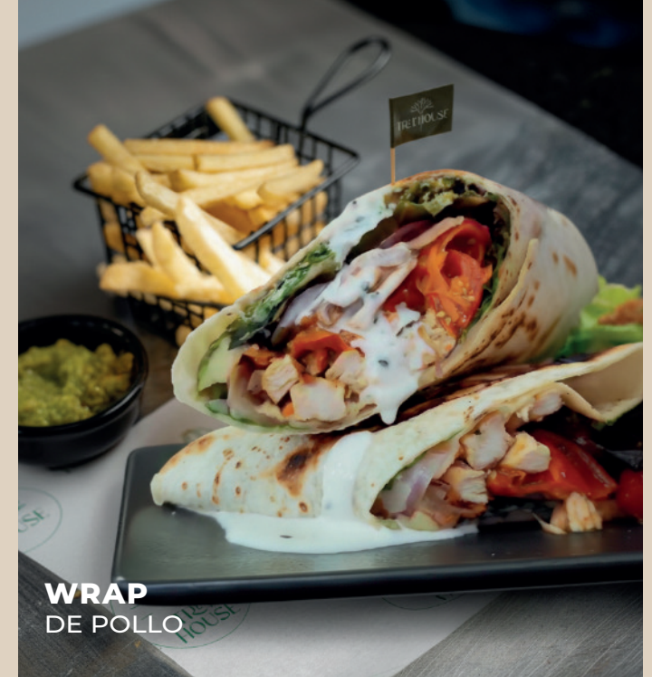
WRAP DE POLLO