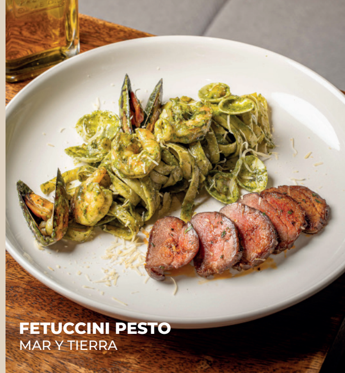
FETUCCINI PESTO MAR Y TIERRA