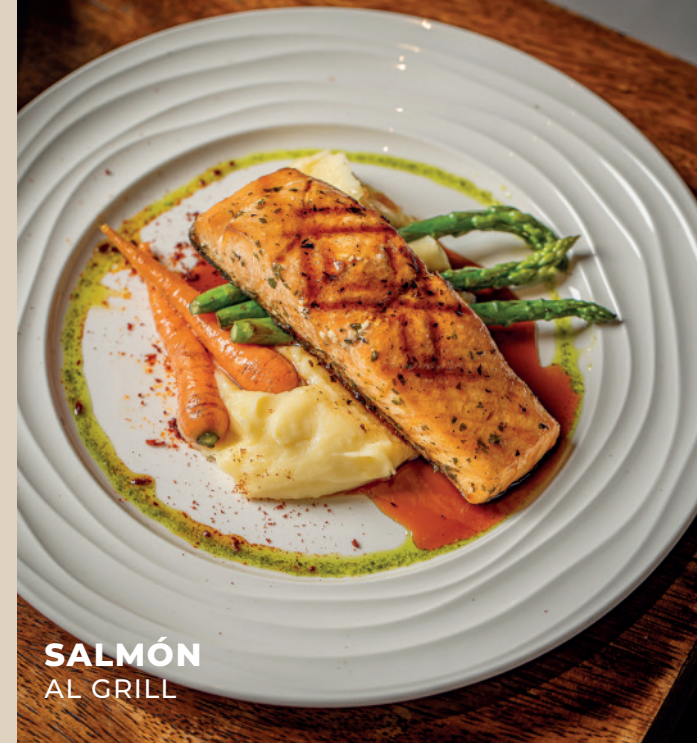
SALMÓN AL GRILL