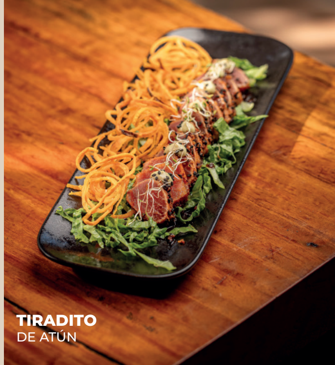
TIRADITO DE ATÚN

Delicadas láminas de pulpo en leche de tigre de maracuyá, donde la acidez y frescura se funden en equilibrio perfecto.